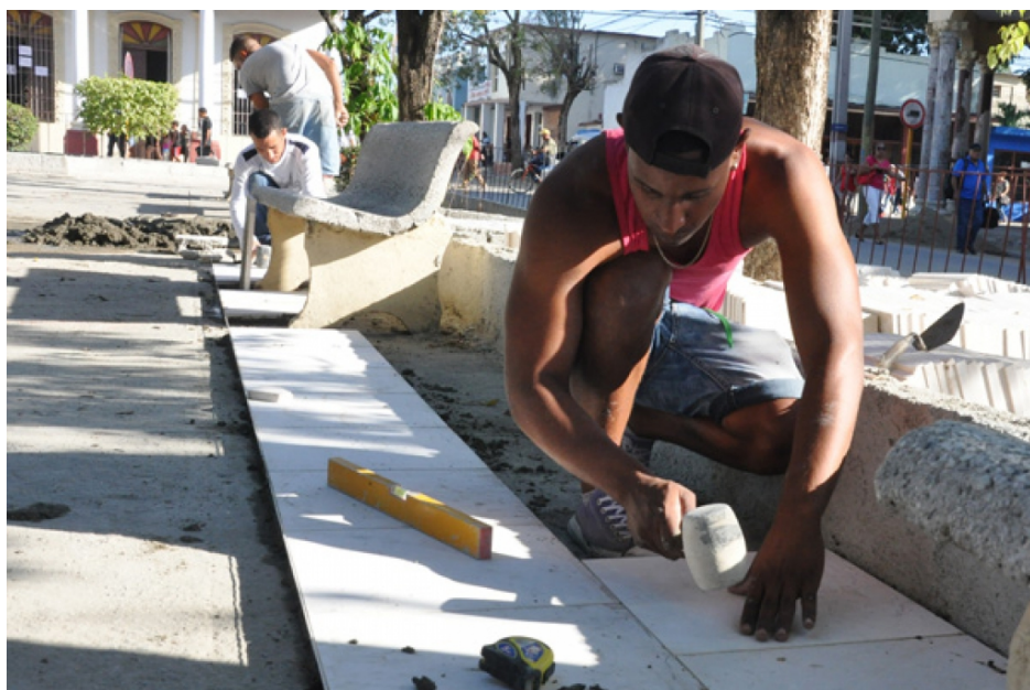
Las Tunas. - Tres años

después de que los gobiernos locales pudieran finalmente decidir qué hacer con la contribución al desarrollo local, el empleo de esos fondos parece encarrilarse por el camino correcto, opinaron directivos de Economía y Planificación en esta provincia del oriente cubano; no obstante, advirtieron que dichos avances solo serán irreversibles cuanto más se asiente en los decisores una visión estratégica y proactiva en el uso de ese capital.